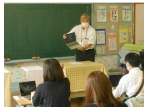
<懇談会(タブレット体験)>