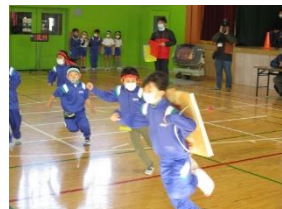
<動くジャンボカルタ取り大会>